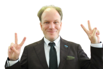
ALT パトリック・ファーガソン