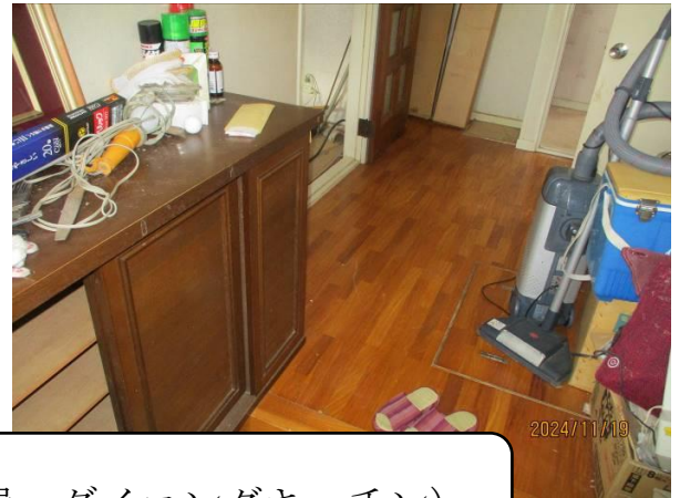
1階（リビング 和室2部屋 ダイニングキッチン）