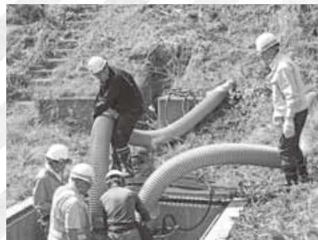
水防共同訓練の様子

令和5年7月25日に役場、喜茂別建設協会、警察、消防など関係機関による水防共同訓練が行われました。また、町ホームページから、喜茂別町防災マップ(ハザードマップ)がダウンロードできます。自宅の周辺や勤め先・学校など身近な場所、通勤・通学路など普段利用する道路の土砂災害警戒区域や洪水浸水想定区域等を調べておきましょう。