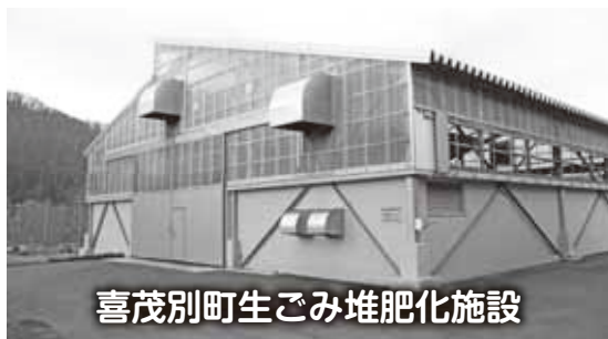
喜茂別町生ごみ堆肥化施設

ゴミを燃やすと、温室効果ガスであるCO 2 が排出されます。通常のごみに比べ、水分量が多い生ゴミは、焼却に非常に多くのエネルギーが必要となり、多くのCO 2 が排出されてしまいます。