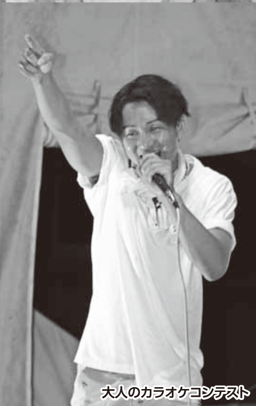
大人のカラオケコンテスト