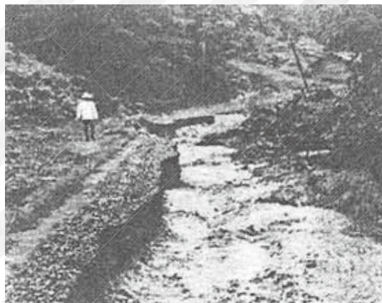
金山決壊地区(昭和56年8月)

昭和23年の大水害では2名の方が亡くなり、昭和56年の台風12号及び15号がもたらした水害は本町史上最悪の水害と言われています。また、平成30年北海道胆振東部地震では震度4を観測した本町でも大規模停電が発生しました。