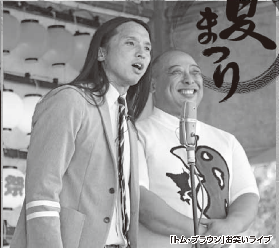
「トム・ブラウン」お笑いライブ