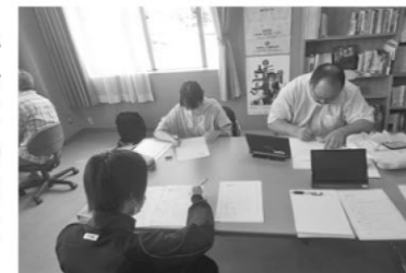
スマイル塾夏期学力アップ講座

図書室内談話室・スマイル塾(インターネット塾)で、町内中学生を対象にスマイル塾夏期学力アップ講座が開催されました。今回は喜茂別中OB・OGの高校生、大学生並びに町内教員経験者の方を特別講師に迎え、学習会が進められました。参加した中学生は、国語、数学、英語を中心にスマイル塾のドリルを活用しながら問題に取り組み、先輩たちの説明に真剣に聞き入りながら集中して学習に取り組んでいました。