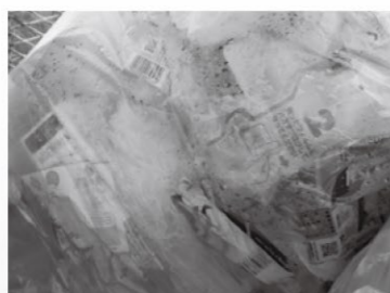
濡れたものが入っている。