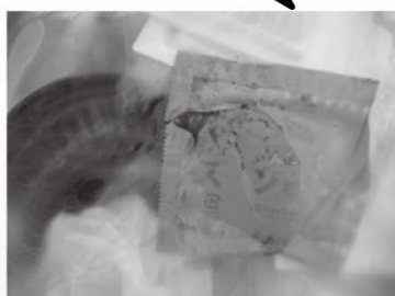
汚れたものが入っている。 例 たれの袋・弁当の容器等