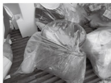
廃プラスチック以外のものが入っている