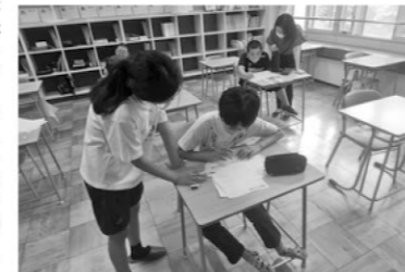
スマイル塾小学生夏休み学習会

喜茂別小で、町内小学4~6年生を対象にスマイル塾小学生夏休み学習会が開催されました。夏休み中の規則正しい生活と学習習慣の定着を目標に開催されたこの会では、しりべしジュニアリーダー事業に参加している中学生が先生となり、それぞれ工夫を凝らし参加者に問題の解き方をやさしく教えていました。