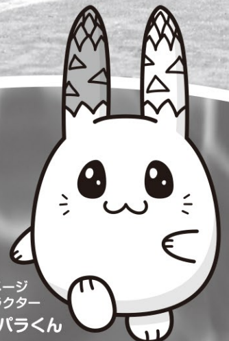
町イメージ キャラクター ウサパラくん

7月4日、さわやかな夏空のもと、喜茂別小学校では体育の公開授業が行われました。新型コロナウイルス感染症予防の観点から今年の運動会は中止となりましたが、授業では徒競走や低・高学年リレーが行われ、保護者の皆さんが日頃の学習の成果を参観していました。