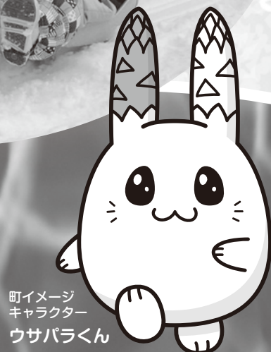
町イメージ キャラクター ウサパラくん

グラウンドに雪が高く積み上げられたら楽しいそり遊びが始まります。園児たちはひとりで滑ったり先生と一緒に滑ったり、そりのスピード感を味わいながら外遊びの時間を過ごしました。