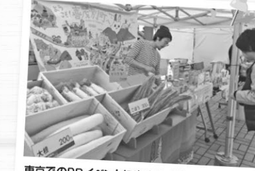
東京でのPRイベントに出店もさせてもらいました。