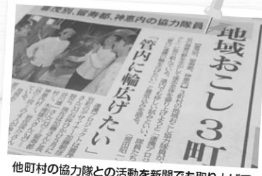
他町村の協力隊との活動を新聞でも取り上げてもらいました。