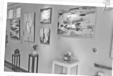
2度企画展を開催しました。