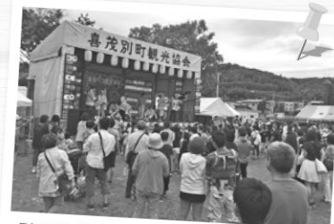
引越し初日は夏祭りが行われていました。