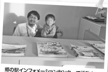
郷の駅インフォメーションセンターで活動をしていた時期もあります。