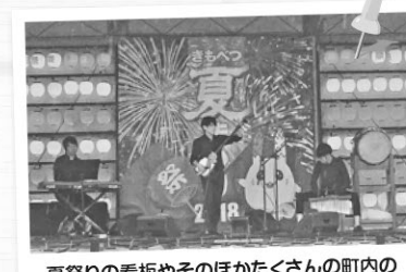
夏祭りの看板やそのほかたくさんの町内のイベントポスターを製作しました。