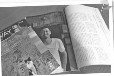
雑誌に活動の様子を寄稿してもらいました。