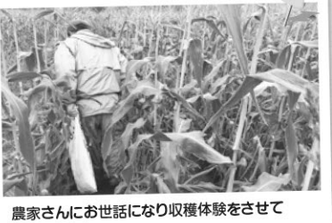
農家さんにお世話になり収穫体験をさせてもらいました。