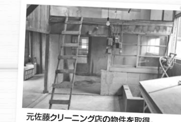
元佐藤クリーニング店の物件を取得。自分で改修をし始めました。