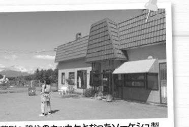
喜茂別へ移住のキッカケとなったソーケシュ製パンさん。ここからの景色はお気に入りです。