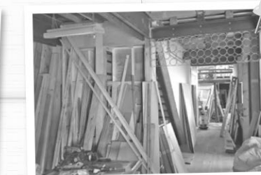
人・もの・情報のあつまるスペースを準備中です。