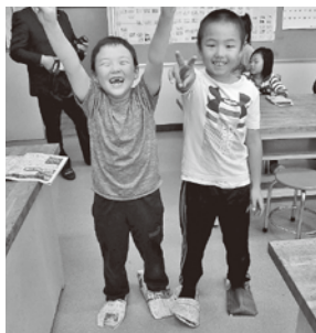
1,2年生は身の回りにある新聞紙で災害時に役立つスリッパを作りました。

11月15日(金)に北海道と北海道教育委員会が推進する「1日防災学校」が喜茂別小学校で実施されました。「1日防災学校」とは授業の中に防災の要素を取り入れ、児童生徒が防災について考える機会をつくろうという取組です。児童達は楽しみながら授業に参加し、避難所での生活や災害から身を守るための話に真剣に耳を傾けていました。