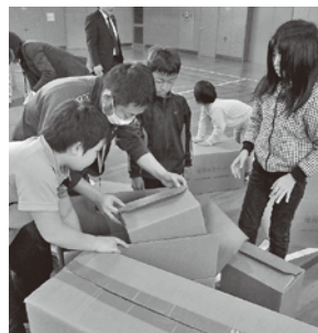
3,4年生は段ボールベッド制作で避難所生活を模擬体験しました。