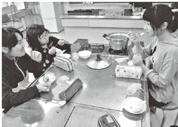
5,6年生は災害救助用炊飯袋で災害時の炊飯を体験しました。 ※災害救助用炊飯袋：災害時、手軽で衛生的に炊飯等の調理ができる強化ポリエチレン製の袋。