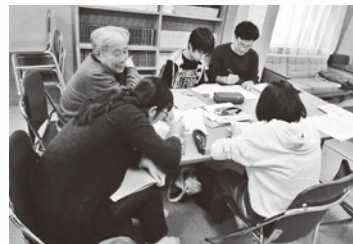
昨年度の講習会の様子