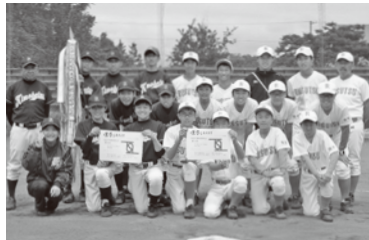
喜茂別中学校・留寿都中学校合同チームのメンバー

6月23日(土)～25日(月)に余市町・仁木町で開催された後志中学校軟式野球大会に喜茂別中学校は留寿都中学校との合同チームで出場し、決勝で共和中学校と対戦しました。決勝戦は、最終回2アウト満塁からの逆転サヨナラタイムリーヒットで勝利し、後志大会優勝を決めました。その後、後志代表として臨んだ小樽後志代表決定戦(7月7日(土)余市町営球場)では小樽代表の菁園中学校に勝利し全道大会出場を決めました。