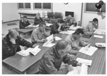
留産・比羅岡地区