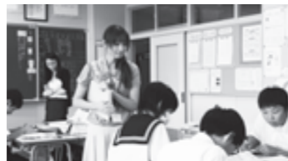
▲喜茂別中学校での食育授業

近年食生活の乱れ（偏食、欠食、不規則な食事時間、食へ過ぎ、無理なダイエット、野菜の摂取不足、運動不足等）に伴い、様々な病気を発症させる、大きな問題となっています。そこで喜茂別町の皆さんの健康状