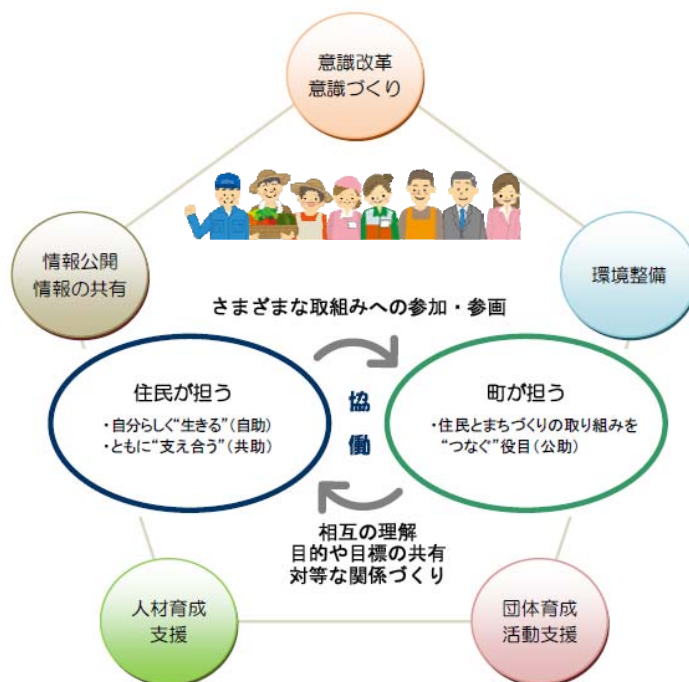
図表 協働によるまちづくりのイメージ

協働のまちづくりを実現するためには、これまでの「公共サービスを行政だけが担う」という公助中心の行政主導による地域づくりから、個人でできることは個人が（自助）、それができないときは地域が（共助）、それでもできないときには行政が（公助）行うという社会の仕組みを構築していく必要があります。こうした『自助・共助・公助』がうまく融合され、住民と行政それぞれが持つ専門的な知識や技術などの特性を生かしながら、住民がお互いに、あるいは、住民と行政が協力して課題解決に取り組んでいくことが求められています。