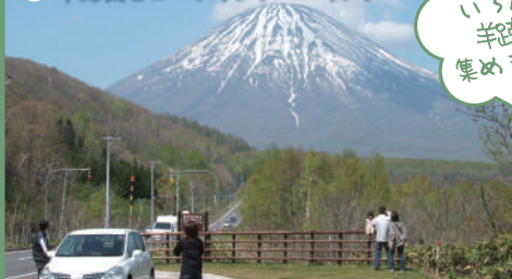
③ 羊蹄山ビューポイントパーキング

夕日が羊蹄山頂に重なる、年に数日だけの貴重な自然現象。喜茂別町の③付近では、夕日のダイヤモンド羊蹄山を5月下旬と7月に見られます。